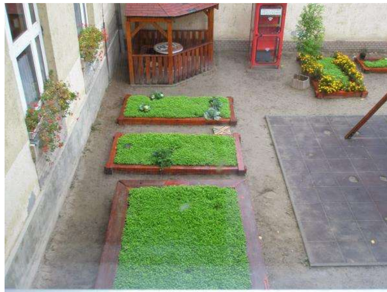
Ady Endre Általános Iskola – Bp. Mustárgyep - zöldtágya