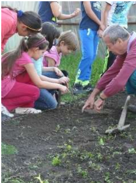
Bajza Lenke Általános Iskola - Zsámbok

A VEVI által fejlesztett iskolakerti útmutatóban jó összefoglalót találhattok a májusi aktuális teendőkről, : http://www.iskolakertekert.hu/kertmuveles-az-iskolakertben/havi-tevekenysegek