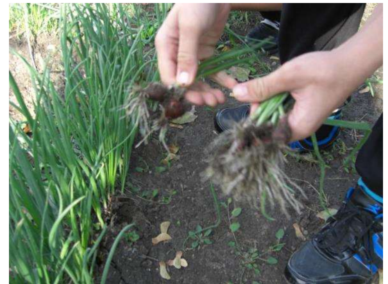
Szent István Körúti Általános Iskola és Speciális Szakiskola - Jászberény