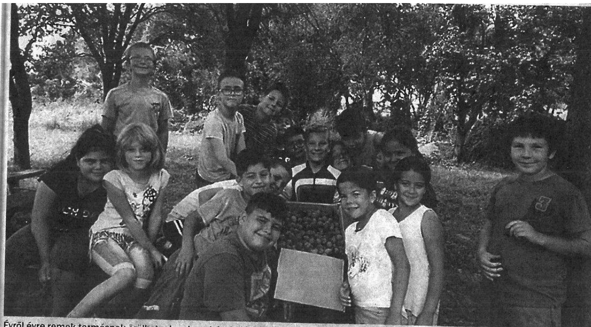
Évről évre remek termésnek örülhetnek a dorogházai diákok - iskolakertjük országos szinten is példamutató