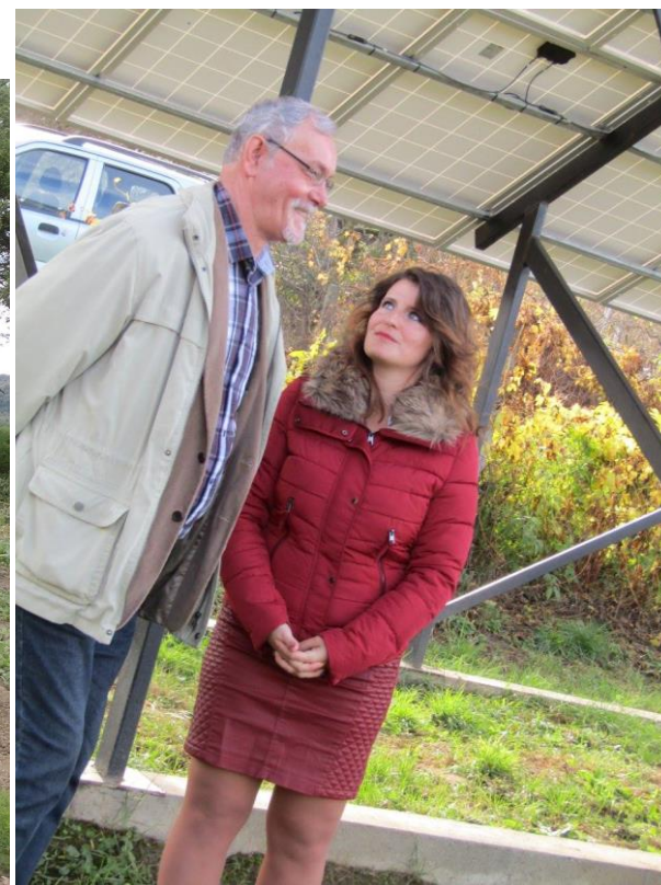
Vendégeink kertlátogatáson az Apor Vilmos Katolikus Főiskoláról: